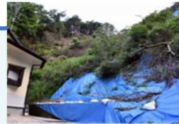
豪雨の度に 土砂崩れが多発