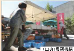
直売所(購買施設)