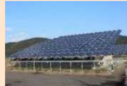
再エネ発電設備 など