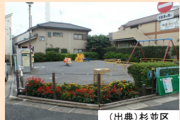
(出典) 杉並区 ポケットパーク(公園)