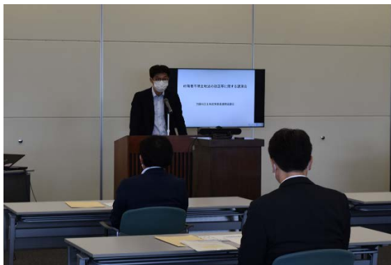
挨拶(国土交通省大臣官房土地政策審議官)