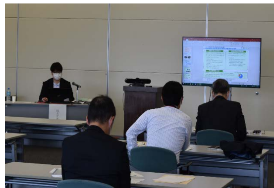
講演(国土交通省不動産・建設経済局土地政策課)