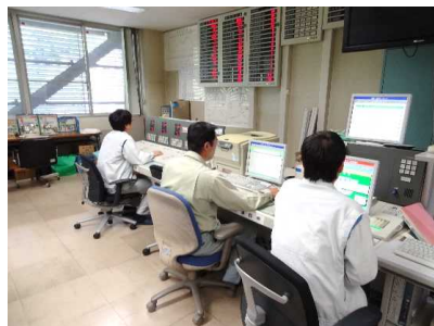
防災操作検討状況