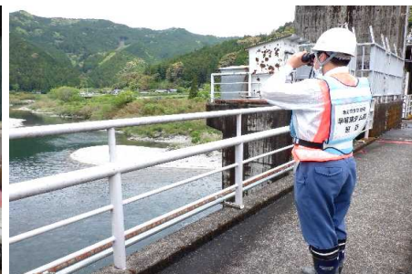
ダム下流河川の巡視状況