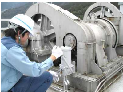
ゲート放流前の機械設備点検状況