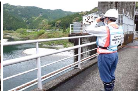
ダム下流河川の巡視状況