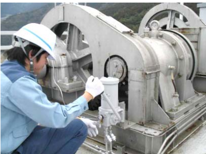
ゲート放流前の機械設備点検状況