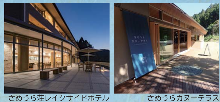
さめうら荘レイクサイドホテル さめうらカヌーテラス

レストランを併設したホテル「さめうら荘レイクサイドホテル」が平成30年にリニューアルオープン、民間活力による拠点施設「さめうらカヌーテラス」が令和2年9月にオープンし、「さめうらレイクタウン」としてさめうら湖の自然体験型観光の拠点と位置づけられています。 湖面やその周辺を利用したカヌーやサップ、サイクリングなどのアクティビティ、道の駅や森林公園との連携イベントを楽しめます。