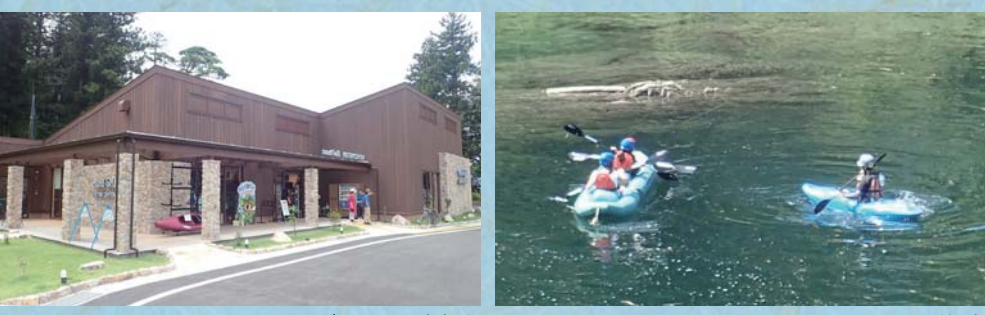
モンベル アウトドアヴィレッジ本山 カヤック体験

帰全山公園の近くには、民間活力による「モンベル アウトドアヴィレッジ本山」が令和元年7月にオープンしました。 飲食・物販や、ラフティング、カヤック、サップ等を始めとする様々なアクティビティ運営が行われています。