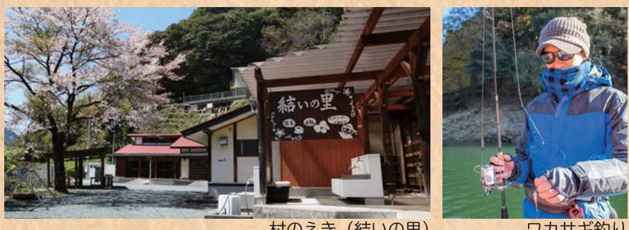
村のえき（結いの里） ワカサギ釣り

「村のえき（結いの里）」は、大川村の観光の玄関施設です。 近隣の情報が豊富に揃っているほか、採れたての農産物や地元の加工品の販売もあり休日には物産物を味わえる食堂もオープンします。 湖畔では観光遊覧やワカサギ釣りクルーズ等の運営が行われます。また、森の駅との連携イベントも楽しめます。