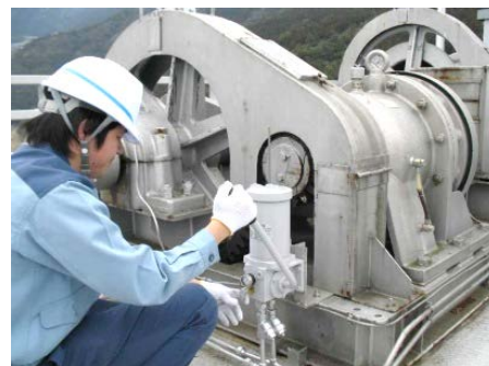
ゲート放流前の機械設備点検状況