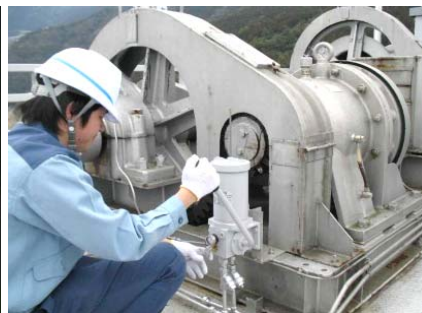
ゲート放流前の機械設備点検状況