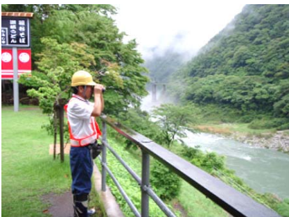
ダム下流河川の巡視状況