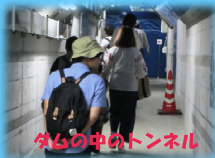
ダムの中のトンネル

当日（10：00～15：00）に整理券をあげさい公園駐車場（シャトルタクシー乗降スペース）付近にて配布いたします。