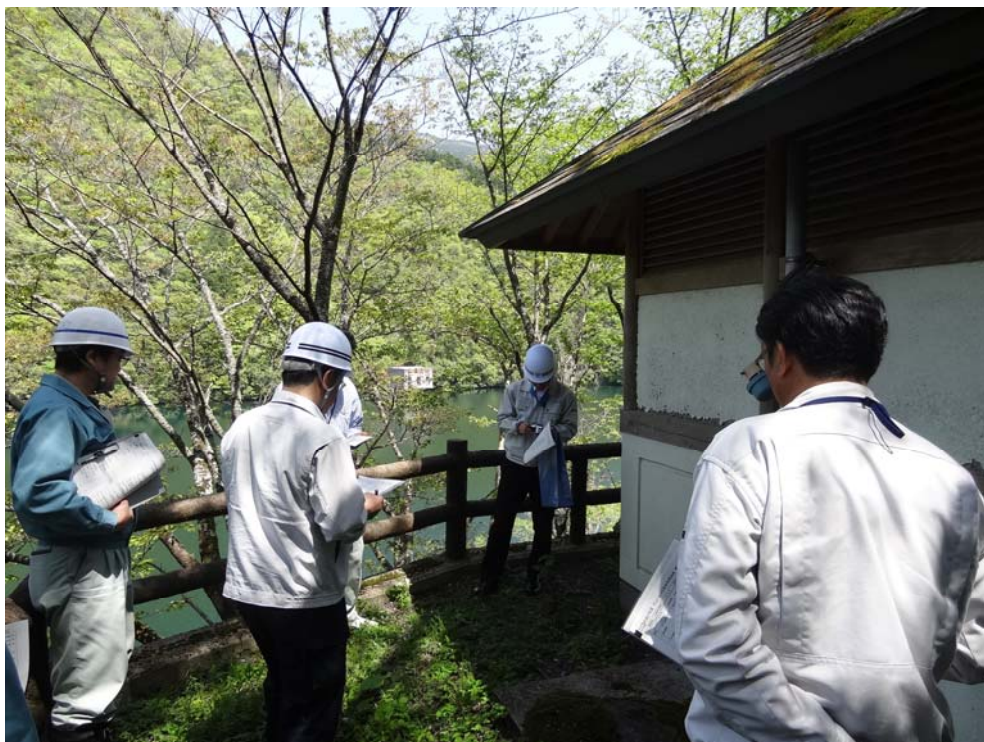
柳瀬ダム周辺点検状況