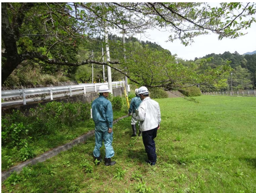
金砂湖畔公園点検状況