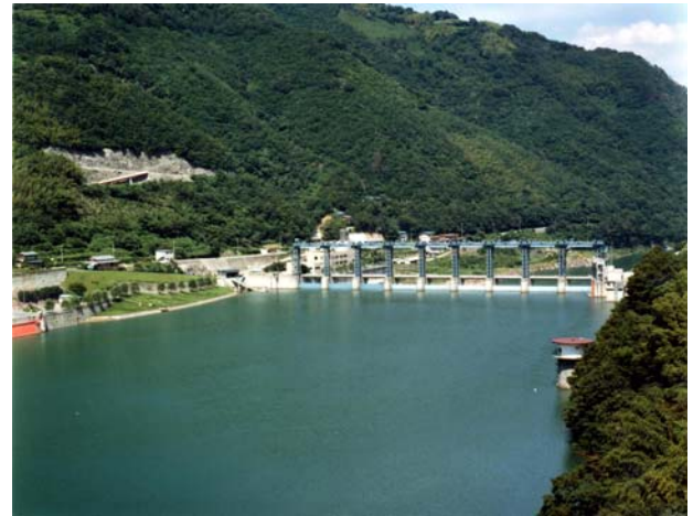
吉野川の右岸側上流からみた池田ダム

定員：30名程度 (応募者多数の場合は抽選) 募集期間：平成20年11月10日(月)～ 平成20年11月26日(水)(必着) 応募方法：裏面参照