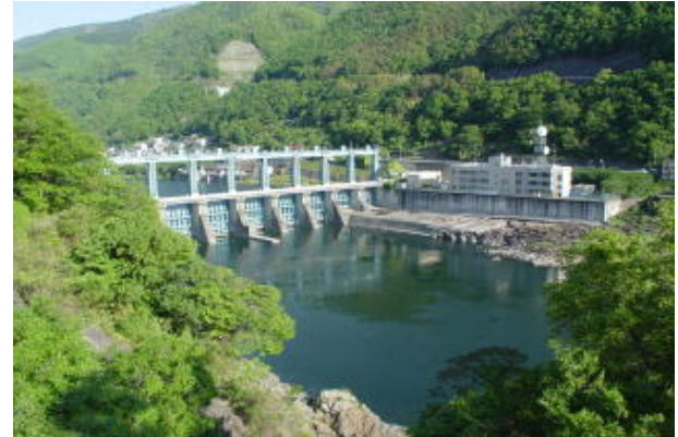
吉野川の右岸側下流からみた池田ダム