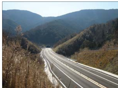
写真-4 歯長トンネル坑口