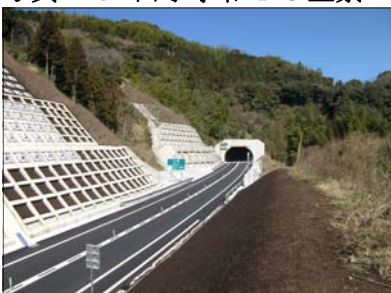
写真-6 新屋敷トンネル坑口