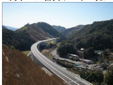
写真-7 高光高架橋全景