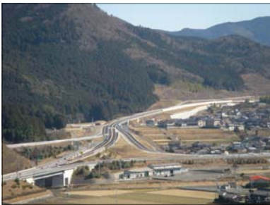
写真-3 西予宇和IC全景

本路線の開通により四国8の字ネットワークのミッシングリンクが1つ解消され、地域活性化や安全安心の確保など、多面的な効果が発揮され、真に「命の道」としての役割を十二分に果たせるものと考えています。