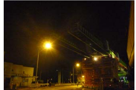
写真-1 手延べ機の送り出し状況