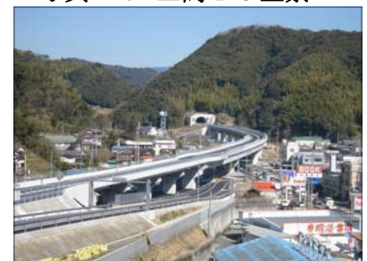
写真-8 申生田高架橋全景