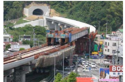
写真-2 橋桁送り出し後の状況

又、高光トンネルでは掘削後の地山の挙動を管理するA計測（天端・脚部沈下測定および内空変位測定）の自動化や、出来形断面形状を詳細に把握できる三次元レーザースキャナを用いた出来形計測を適用するなどの情報化施工を実施しました。