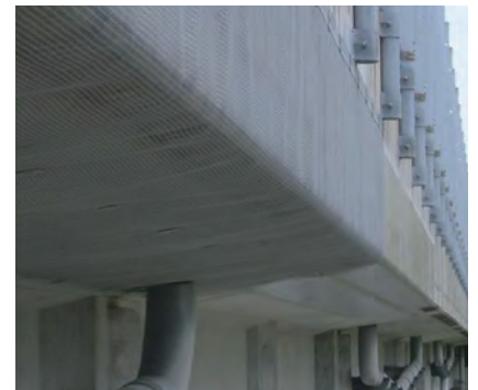
スマートメッシュ敷設完了