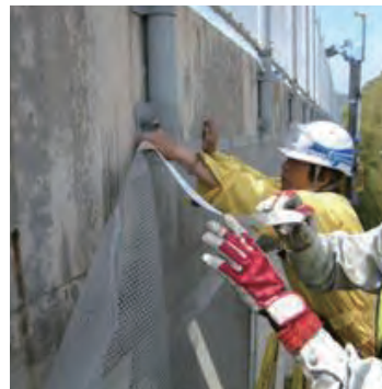
スマートメッシュ敷設状況

本技術は、コンクリート片のはく落防止対策ネット工法で、従来のはつり・断面修復工法に比べ、本技術の活用により短期間で経済的に剥落防止が可能となり、施工後にはひび割れ等の目視観察ができる他、容易に部分補修が図れます。