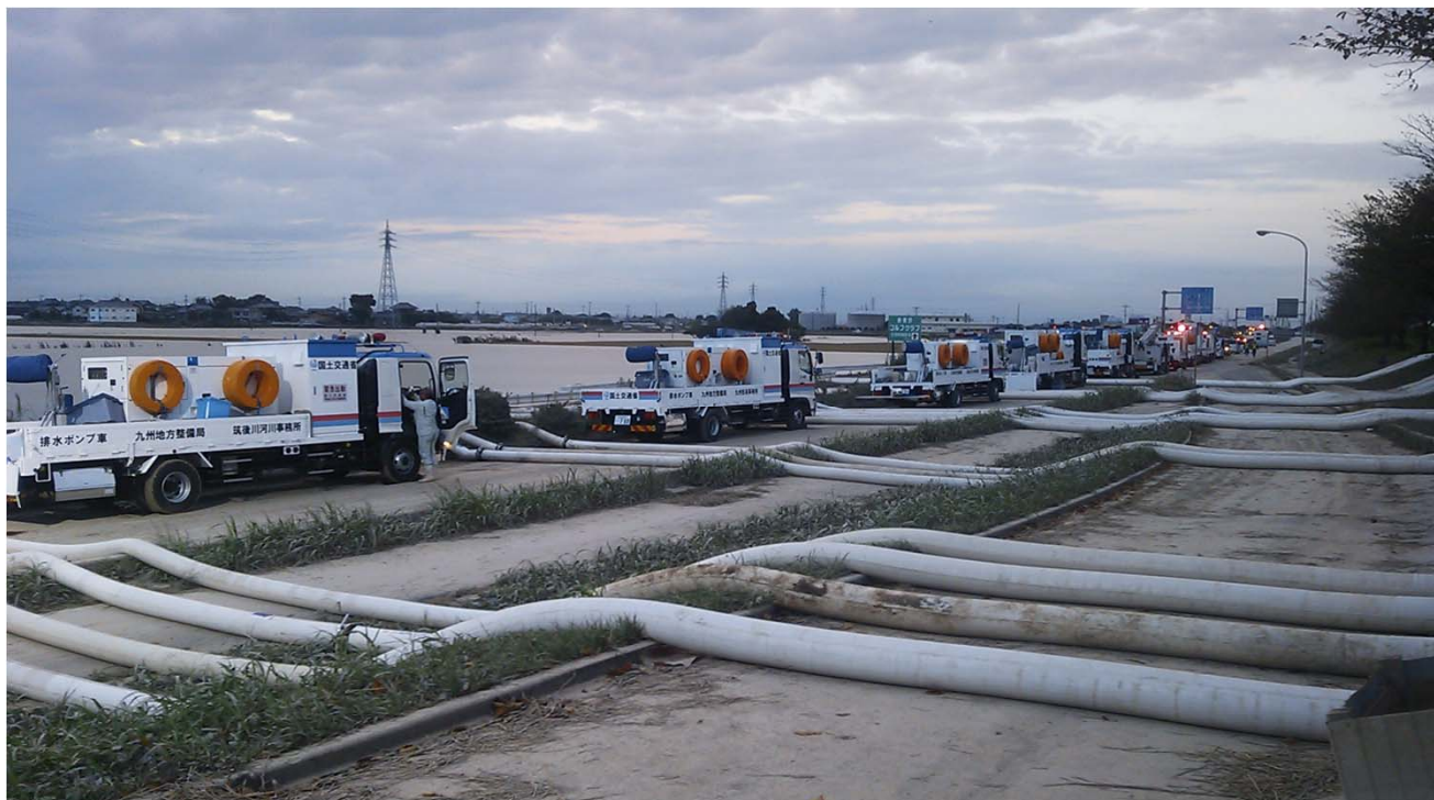
鬼怒川破堤により浸水した茨城県常総市での排水作業状況①