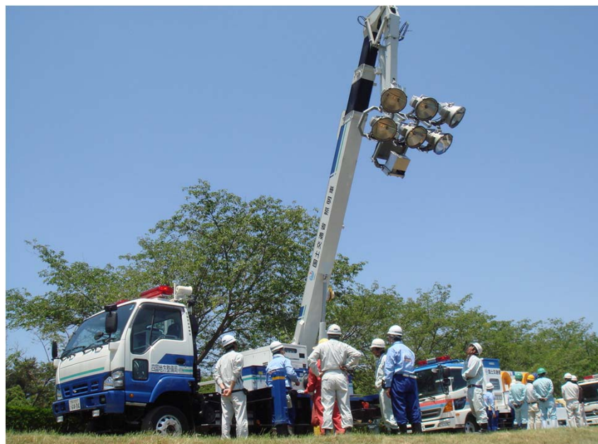
写真四 照明車の取扱い習熟訓練