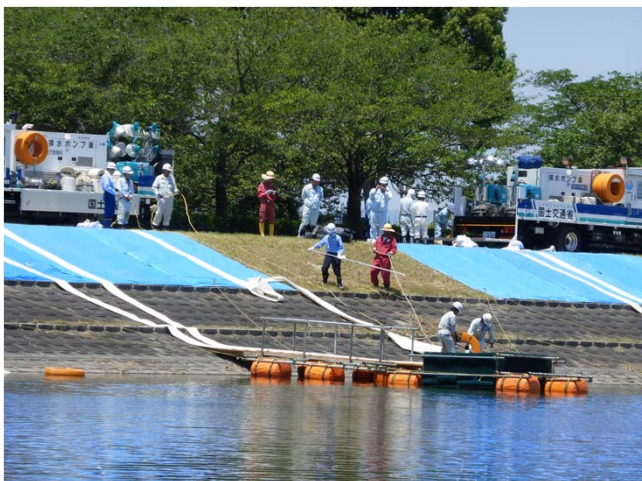
写真二 設営訓練状況