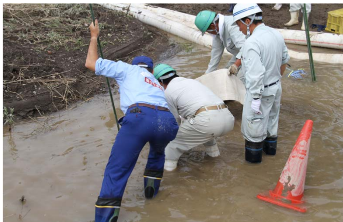
排水ポンプの設営作業状況