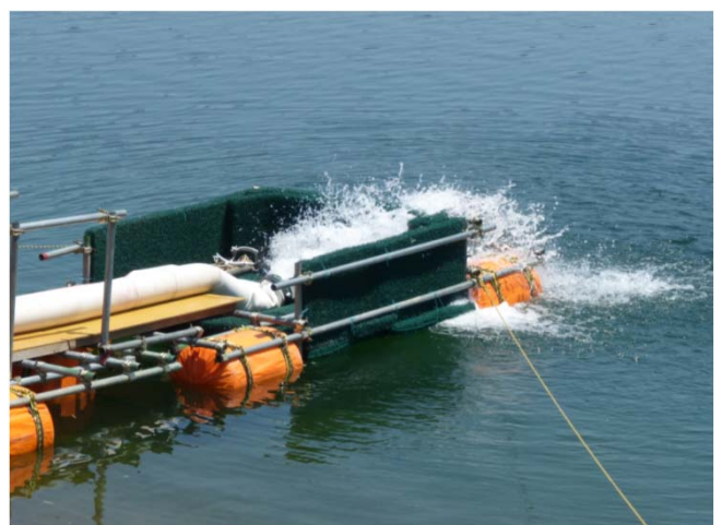
写真三 排水状況(訓練時)