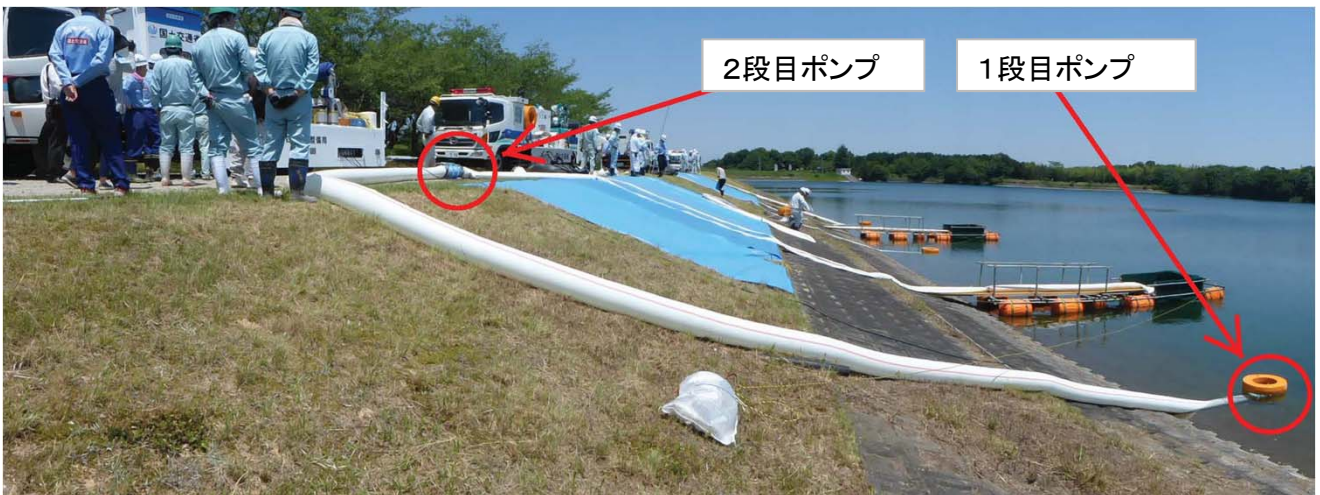
写真-5 排水ポンプ車(高揚程型)の設営状況