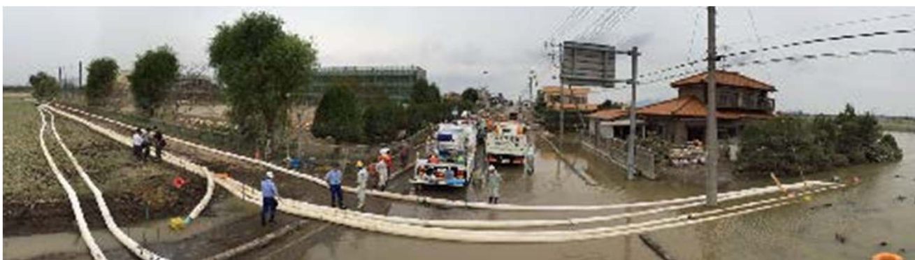
鬼怒川破堤により浸水した茨城県常総市での排水作業状況②