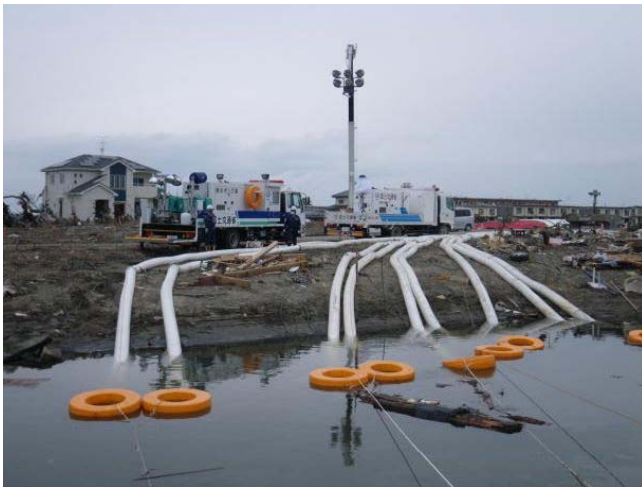
東日本大震災で活躍する排水ポンプ車