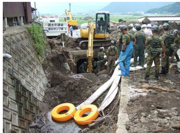
平成24年7月九州北部豪雨による災害に出動