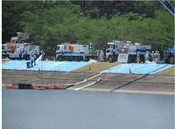
平成25年度の操作訓練の様子