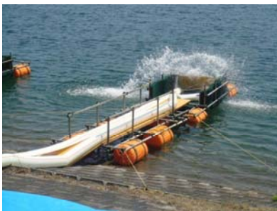
ポンプにより排水中