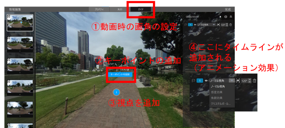
StudioVRでの画面操作イメージ