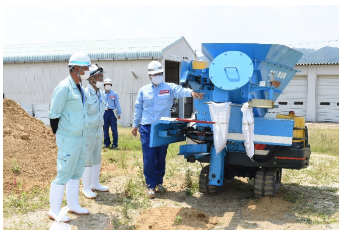
土のう造成機説明