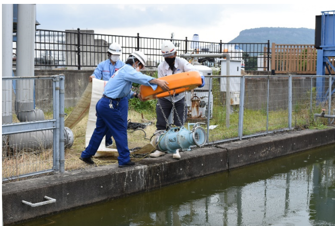
四技敷地内水槽にて排水運転を実施