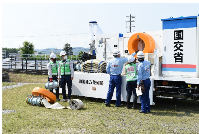
排水ポンプ車フロート等説明状況