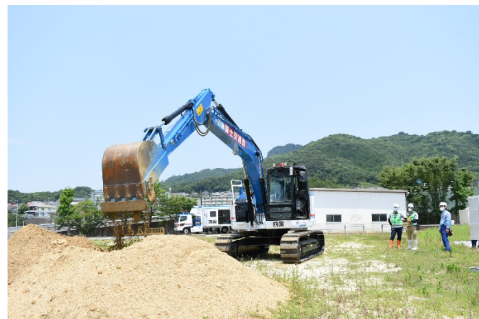
遠隔操縦式バックホウ説明