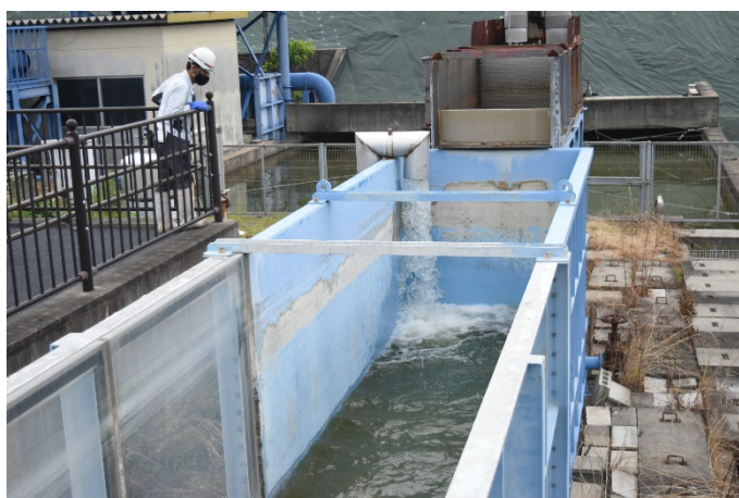
試験水路への排水状況