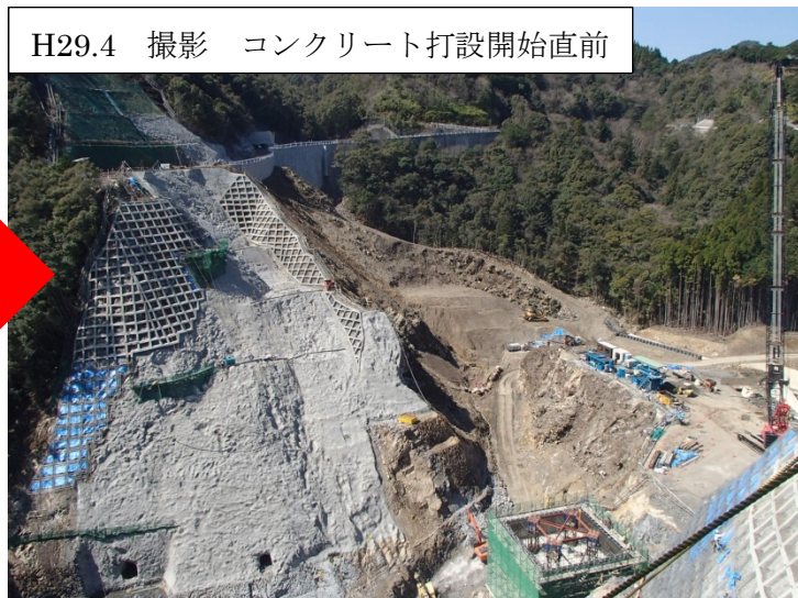
H29.4 撮影 コンクリート打設開始直前