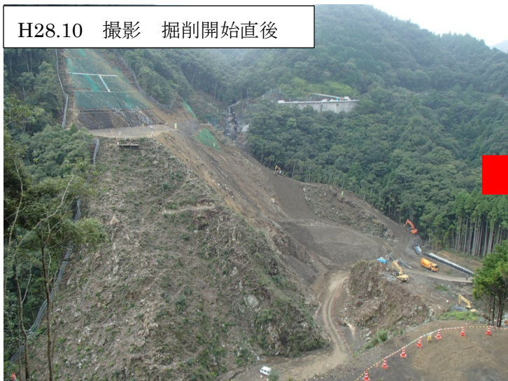
H28.10 撮影 掘削開始直後