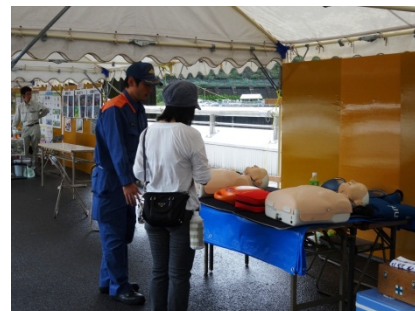
消防署のブースではAED講習が行われました。