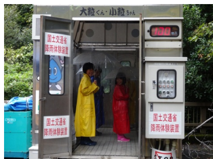
降雨体験装置ではどしゃぶりの雨量を体験！