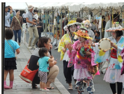
ちんどん屋が会場内を練り歩き！奇抜な衣装とメイクに子どもはびっくり！？

10月6日(日)中筋川ダムにて蛍湖まつりが開催されました。直前まで雨が降っていたため開催が危ぶまれましたが、10時開催直前に雨が上がって予定通りに始めることができました。ときおり小雨がぱらつくこともあって、予想よりも客足は減りましたが、それでも約1200人が来場されました。