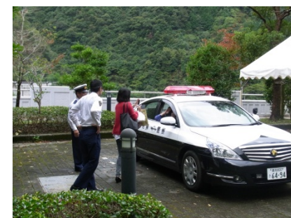
警察署のバトカー乗車体験は大人にも人気