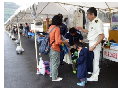
海上保安署の制服試着体験！