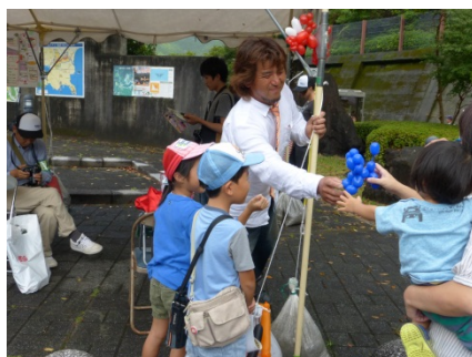
バルーンアートのプレゼント！オーダーに合わせて目の前で作ってくれるので順番待ちも。