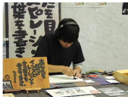
言葉書き下ろしパフォーマンスは、みんな興味津々でのぞき込んでいました。