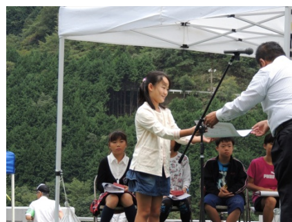
「中筋川ダムの絵」作品表彰式。優秀賞と特別賞受賞者に表彰状と記念品が授与。