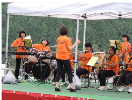
地元中学校ブラスバンド部の演奏は流行曲、アニメから歌つきの演歌までを披露！