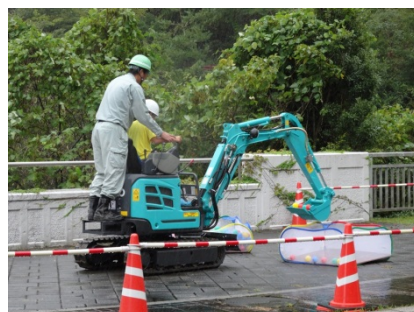
ミニショベルカー乗車体験には子どもたちが列をなしていました。