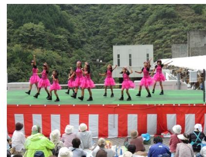
ご当地アイドルグループの元気いっぱい笑顔はじける歌とダンスのステージ！