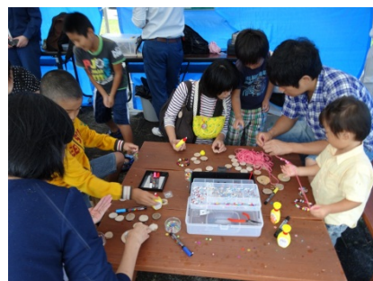
木工教室では木のメダル作り教室に参加。