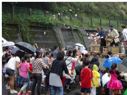
もち・菓子投げで祭りフィナーレ！！