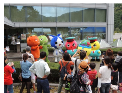
ゆるキャラ大集合☆子どもたちにもみくちやにされながら、最後は一列で撮影会！