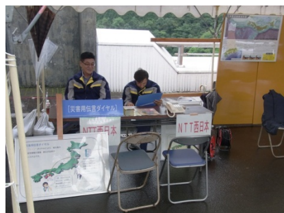
NTT西日本の災害伝言ダイヤル講習会