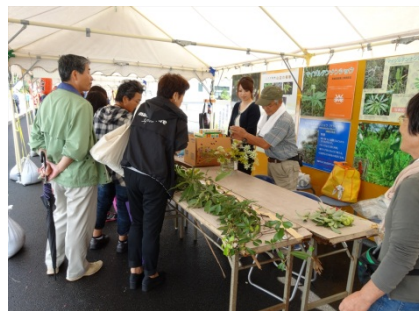
植物の名前当てクイズに挑戦！