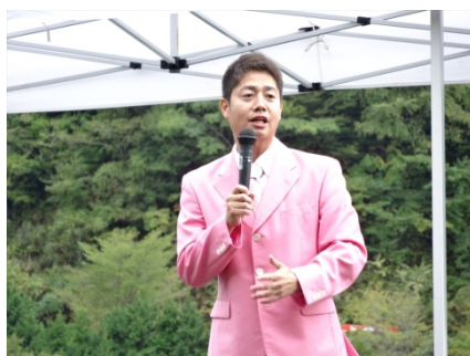
元吉本芸人の軽快なトークが炸裂！テレビ・ラジオで活躍する本人が見られて来場者は大喜び