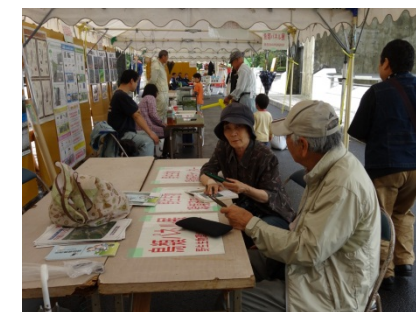
中筋川ダム周辺で見られる鳥の紹介コーナー