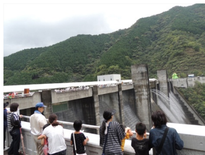
中筋川ダムの特別放水「洗浄放水」は、2回に分けて行われました。