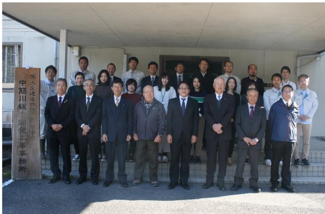
中筋川総合開発工事事務所 玄関にて記念撮影