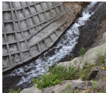
ダム本体上流側の川の流れ

堤体が完成したため、仮排水トンネルをふさいで、川の流れを元に戻し、ダム本体の仮排水路内を流しています。(川の流れを元に戻すことを二次転流といいます。)