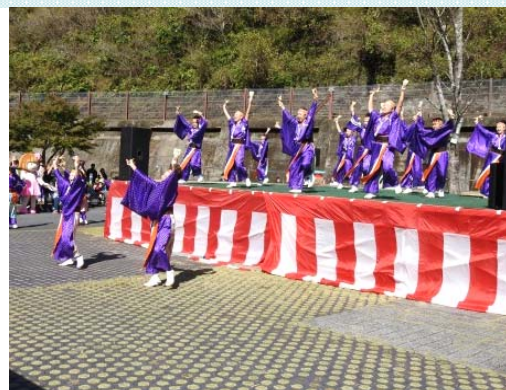
幡多舞人 よさこい踊り