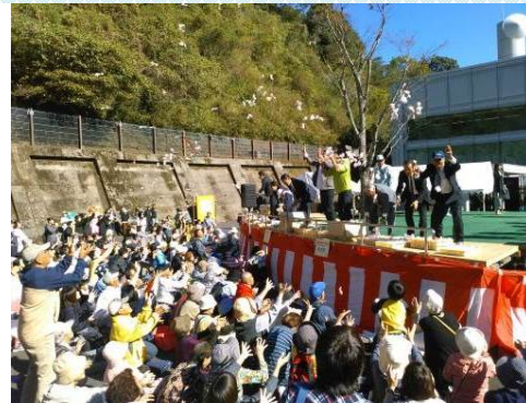
もちなげ・お菓子投げ