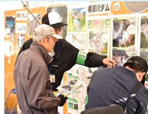
国土交通省中筋川総合開発工事事務所 事業紹介パネル展