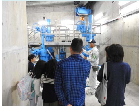
ダム内部見学状況