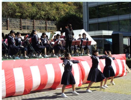
四万十市立中村中学校 音楽部の演奏