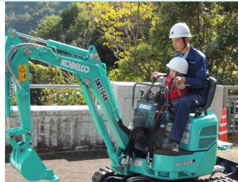
高知県建設業協会幡多支部連合会 ミニバックホウ乗車体験