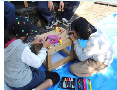
四万十森林管理署 かんたん木工教室