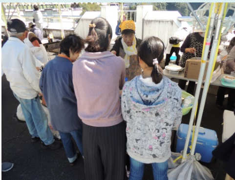
宿毛市連合婦人会