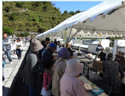
四万十市連合婦人会