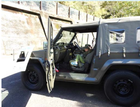
自衛隊高知地方協力本部 特殊車両