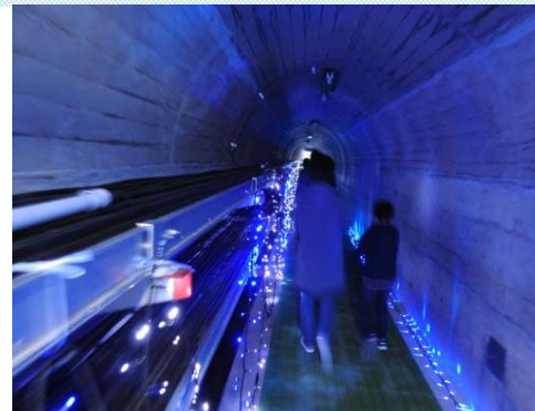
ダム内部イルミネーション