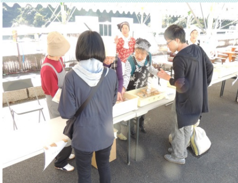
三原村連合婦人会