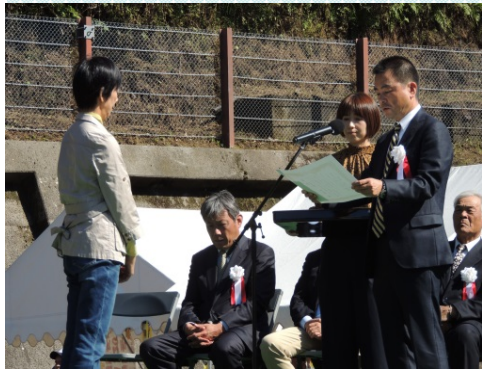
蛍の写真コンテスト表彰式