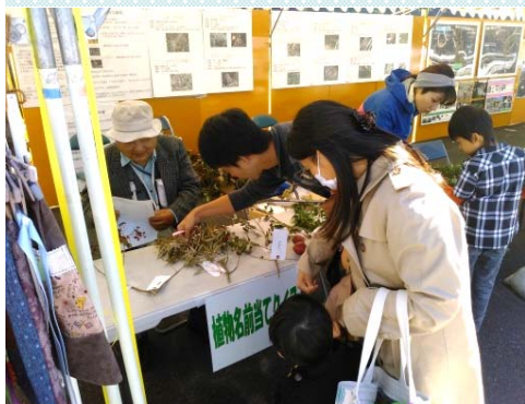
四万十川自然再生協議会 ダム周辺の植物クイズ