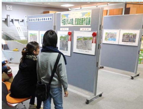
「ダムの絵」児童作品展