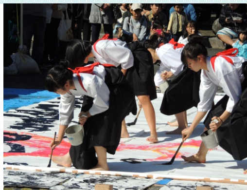
高知県立中村高等学校 書道パフォーマンス