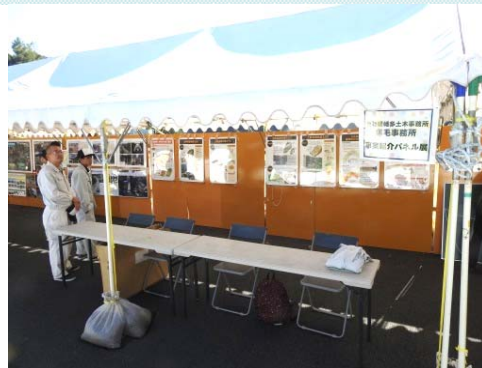
高知県幡多土木事務所 事業紹介パネル展