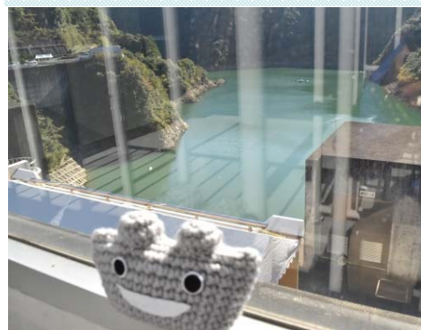
展望ルームから見えるダム湖