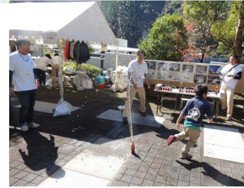
西松建設(株) 理科実験