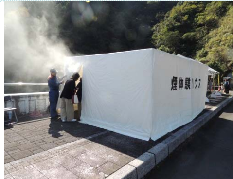
幡多西部消防組合消防本部 けむり体験