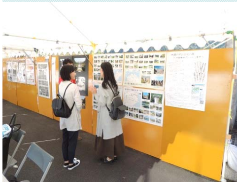
ダムファン パネル展