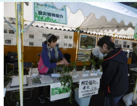
日本防災植物協会 防災植物紹介