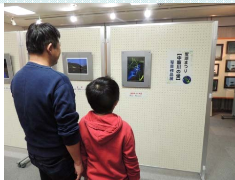
中筋川ホテルの写真展