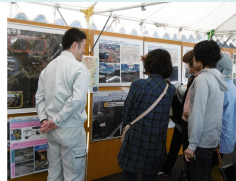
国土交通省中村河川国道事務所 事業紹介パネル展