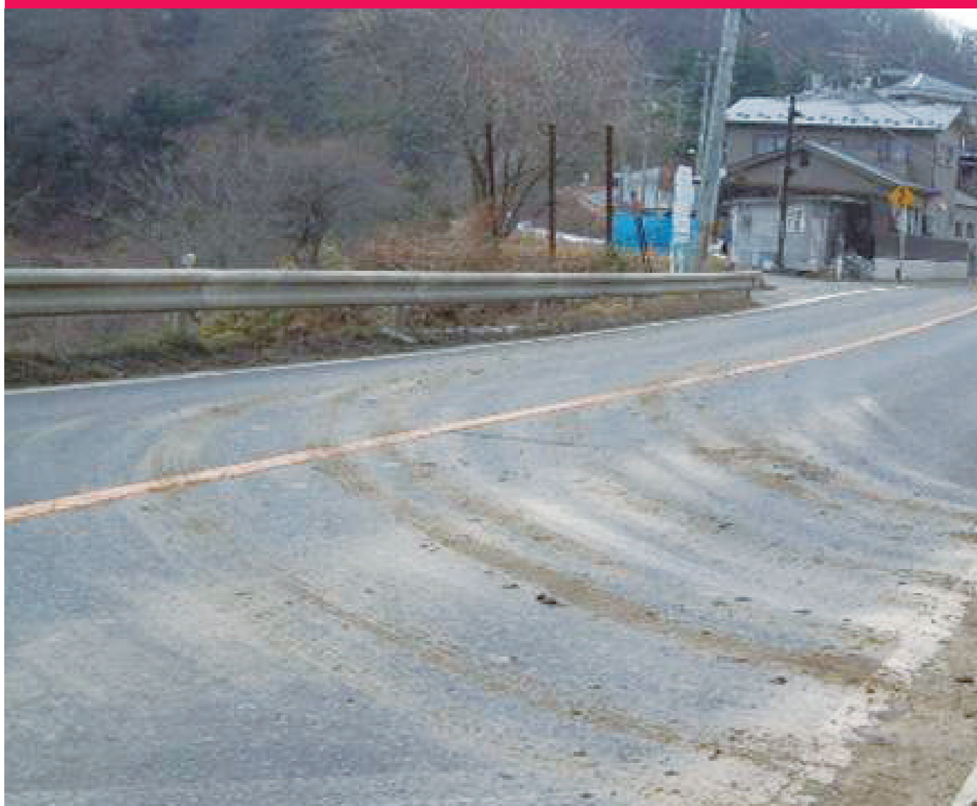
路面の汚れ(油・土砂)