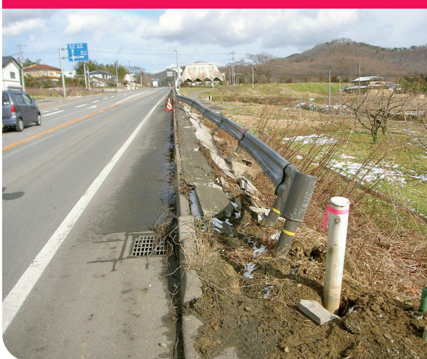
ガードレール・標識等の損傷