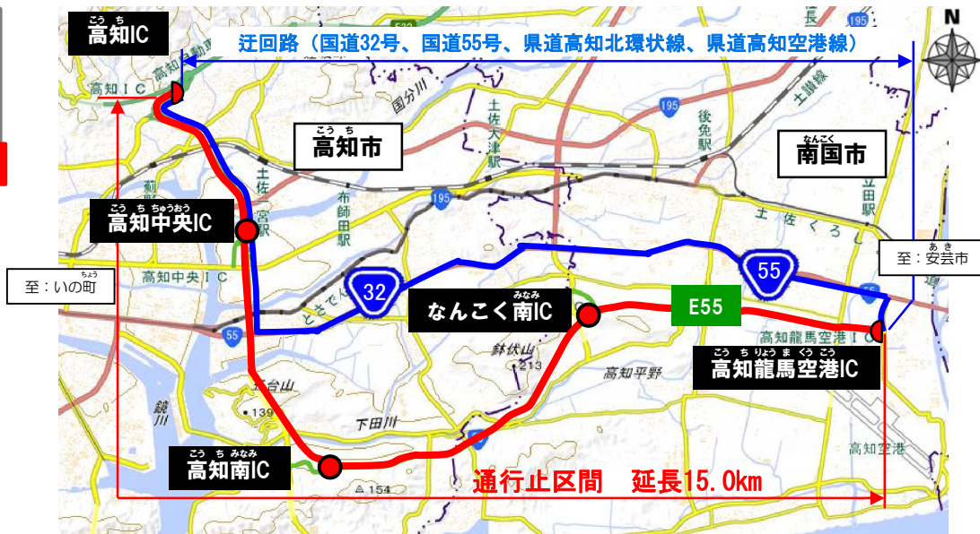
この地図は、国土地理院の地理院地図に加筆したものである。

○問い合わせ先 国土交通省 土佐国道事務所 088-884-0359 日本道路交通情報センター（高知情報）050-3369-6639