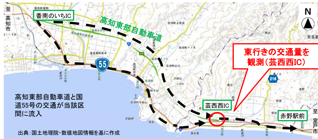
▼対象区間および交通量観測地点位置図

取組日は、事前調査日と比べて、 6:30～7:30 の交通が 6:00～6:30 もしくは 7:30以降 に分散