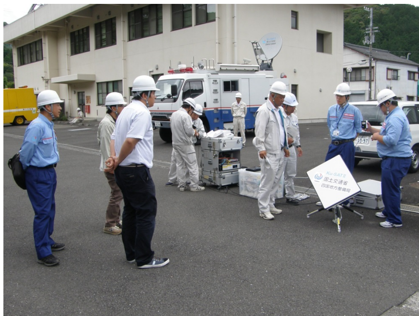
[奥]衛星通信車、[手前]可搬型衛星通信装置