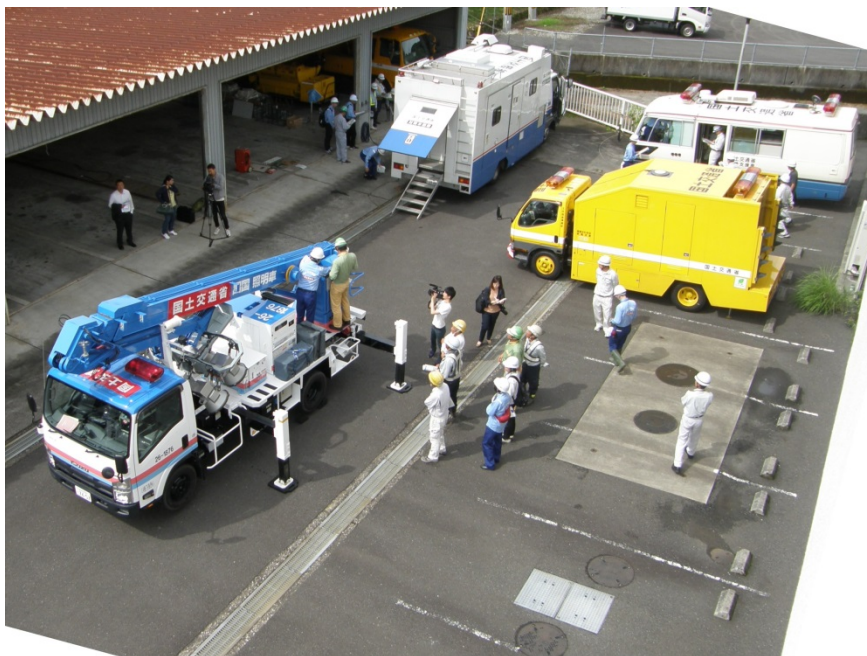
[左奥]対策本部車、[右奥]待機支援車、 [左手前]照明車、[右手前]標識車