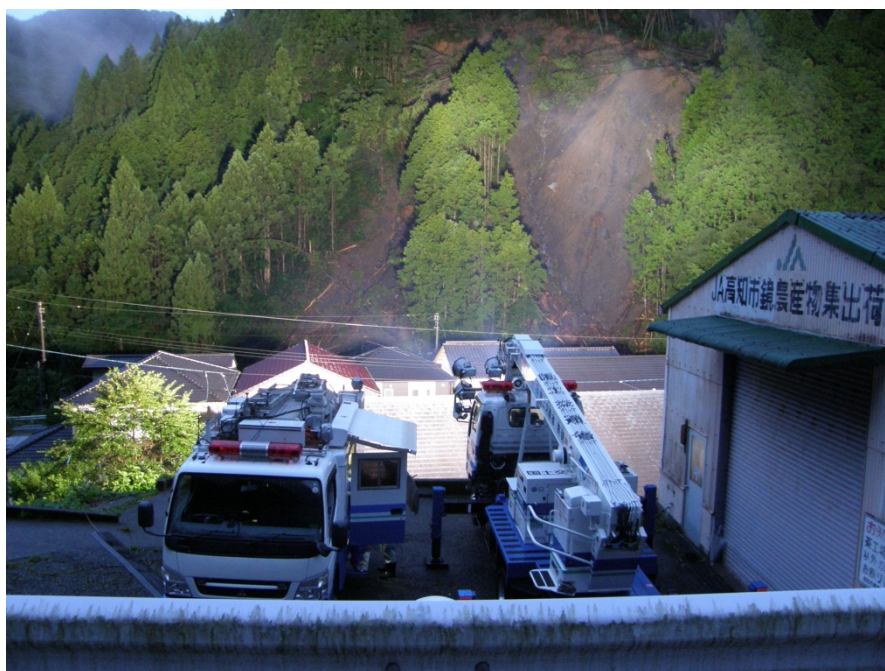
平成26年8月台風12号による崩落(高知市鏡的瀬) 衛星通信車(左)、照明車(右)による監視状況