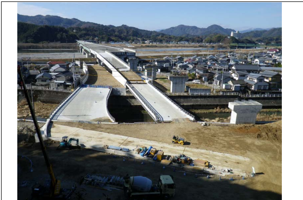
平成 24年度の暫定供用を目指し工事を進めているいの大橋付近 (奥:松山市方面 手前:高知市方面) (平成24年1月6日撮影)