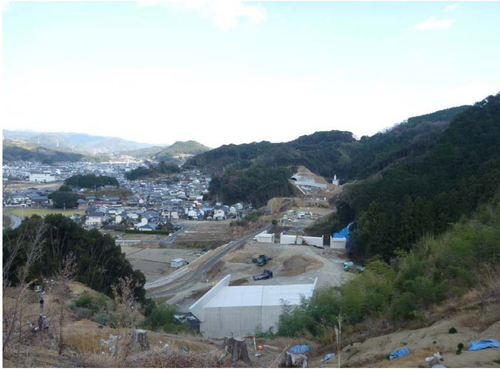
平成 28 年度以降の暫定供用を目指し工事を進めている是友 IC（仮称）付近 （奥:高知市方面 手前:松山市方面） （平成 24 年 1 月 11 日撮影）