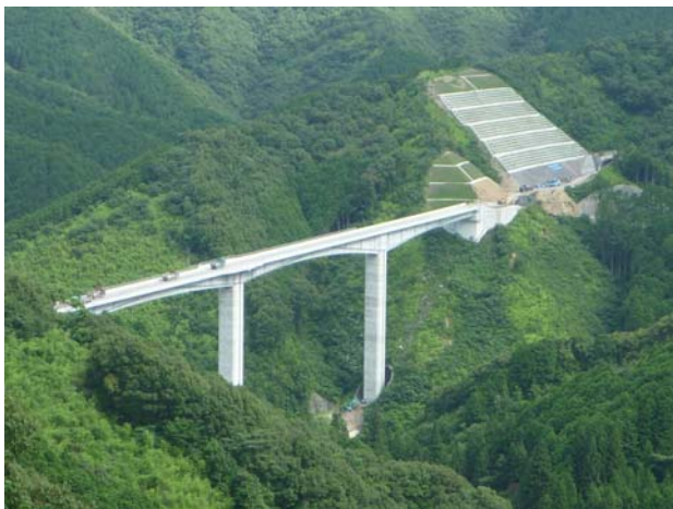
大坂谷川橋 橋脚の高さ74mは四国一。