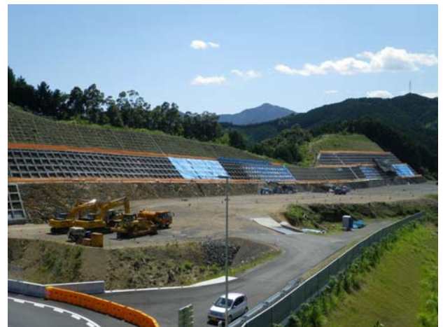
中土佐インター(窪川方面)の工事状況 全体の約9割の切り土が完了している。