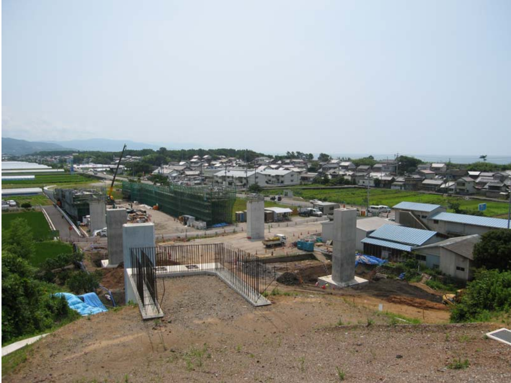
平成 22 年度の供用を目指し工事を進めている芸西西 IC 付近（仮称） （奥:安芸市方面 手前:高知市方面） （平成 22 年 7 月 1 日撮影）