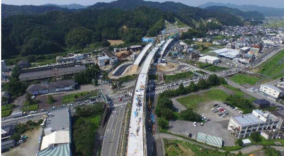
いの町枝川 (撮影方向: 南西向き)