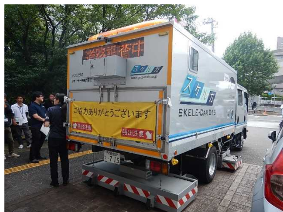
▼写真下 路面下空洞調査技術現地デモ