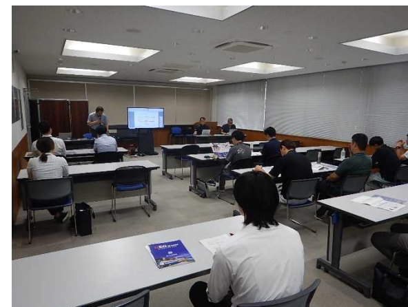
▲写真上 座学の状況