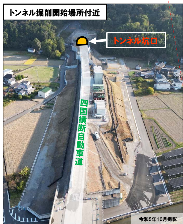
トンネル掘削開始場所付近