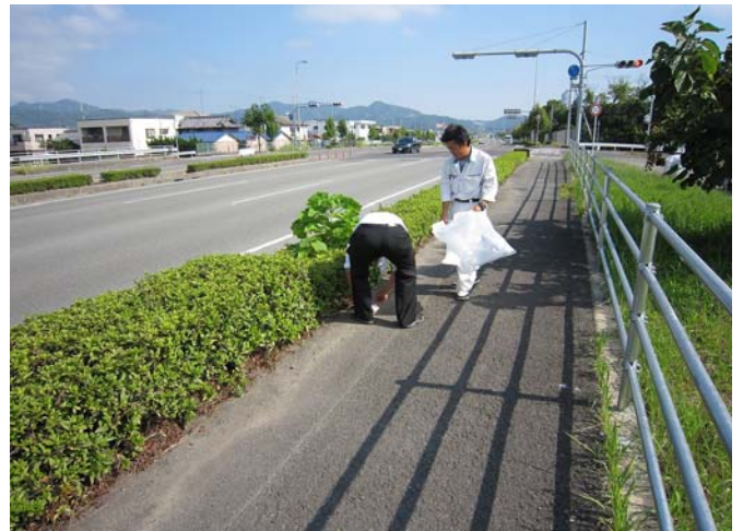
活動状況写真（国道55号線）