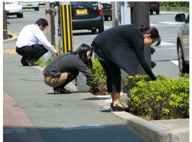
活動状況写真（国道192号線）