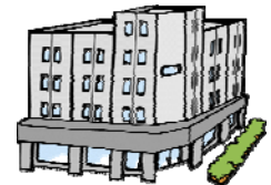
運輸支局、県、市町村道の駅