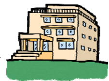
徳島河川 国道事務所