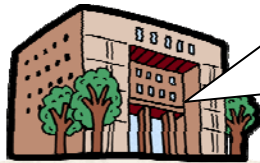
JAF トラック協会、 バス協会、 タクシー協会