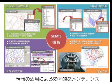
情報の活用による効率的なメンテナンス

東京都区部の下水道は国内最大の規模を誇り、下水道管網の総延長は16,000kmにも達している。 この膨大な下水道管のメンテナンスを効率的かつ効果的に実施するために、「下水道管のビッグデータ」を補修や再構築などの計画立案・工事発注に活用している。 ※「下水道管のビッグデータ」：下水道管基礎情報、維持管理情報、管路内調査診断情報、補修・再構築等の工事情報等に関する膨大な情報