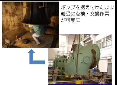
ポンプを据え付けたまま軸受の点検・交換作業が可能に

従来、河川排水用の大型立軸ポンプの水中軸受の点検・整備は構造上、ポンプ本体を引き上げて分解する必要があったが、軸受の位置を工夫することで、ポンプを据付けた状態のままでも水中軸受の点検・整備を可能とした。 本開発技術 (特許取得技術) により、点検・整備にかかる作業コストを大幅に削減でき、また、点検・整備による設備停止期間の短縮もはかれるようになった。