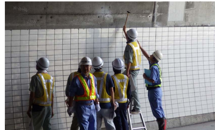
現地実習状況 (H28トンネル初級)