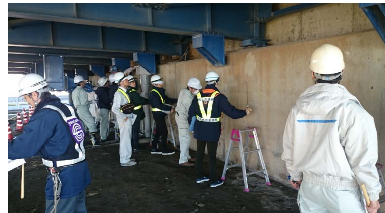
現地実習状況 (H28現場支援セミナー)