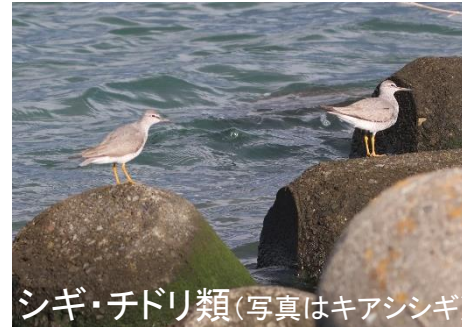
勝浦川河口付近は 渡り鳥のシギ・チドリ類が 飛来する湿地を有する