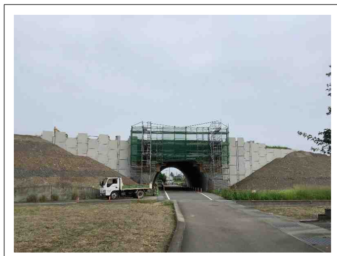
補強土壁を施工しています。