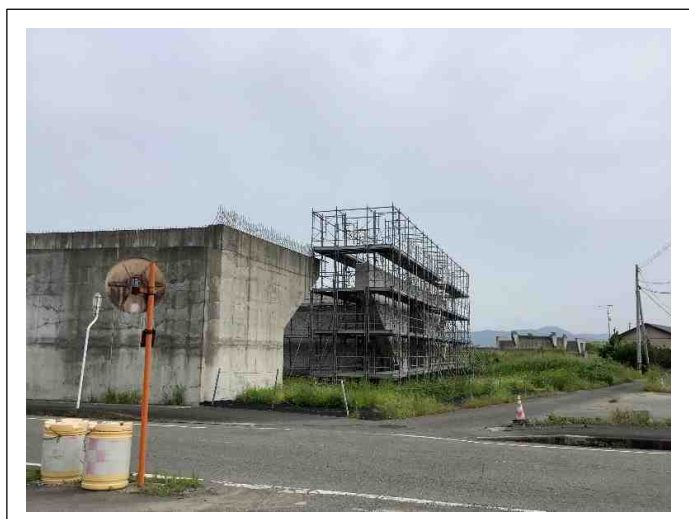
下部工を施工しています。