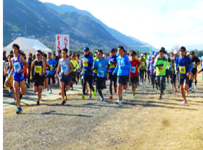
クロスカン トリー大会 県内外から参加する多数のランナーが、駅伝やクロスカン トリー、ファミリー、ファン・ラン ニングなどの各部門で健脚を競う大会が、同施設で開催されている。