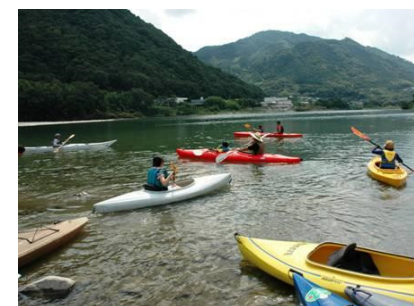
カヤック体験 「AMEMBO」によるリバーカヤック体験では、カヤック未経験者でも、吉野川の雄大な自然を感じながら川遊びを楽しむことができる。