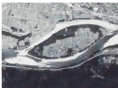
昭和54年頃の中島島 「吉野川今昔Ⅱ」より かつては吉野川と旧河道に囲まれた中州状の島でした。