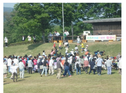
美馬市水辺の楽校春祭り 春には、にぎわいづくりや防災意識を高めるため、自然体験施設「水辺の楽校」において春祭りが開催されている。