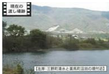
「毛田渡し」の渡し場跡 「吉野川の渡し」より この付近の農耕地と対岸の半田町を船で結ぶ「毛田渡し」があり、平成3年まで利用されていました。