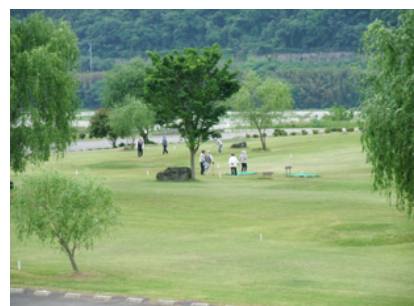
パークゴルフ ふれあいコース9ホールと、ゆうあいコース9ホールからなる全18ホールを完備したパークゴルフ場は、施設、貸し用具ともに無料で利用できる。