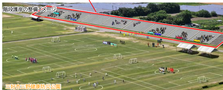
階段護岸の整備イメージ

階段護岸の整備により観覧スペースが確保され、これまで課題とされていた観覧時の堤防の踏み荒らしが解消されることで、ゆっくりかつ安全にイベントを楽しむことができます