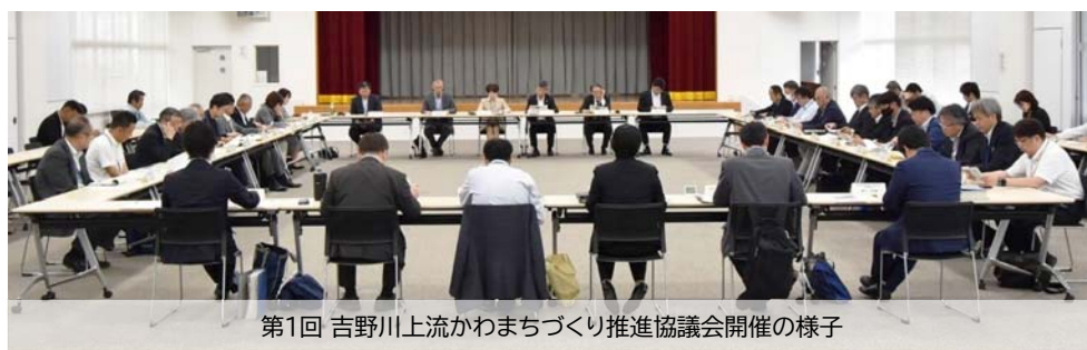
第1回 吉野川上流かわまちづくり推進協議会開催の様子

水辺空間を活かした県西部のさらなる発展を目指して地元自治体や市民団体、有識者と徳島県、河川管理者である徳島河川国道事務所が連携し、「吉野川上流かわまちづくり推進協議会」を設立し、令和7年5月30日(金)に第1回協議会を開催しました。