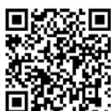
吉野川上流かわまちづくり推進協議会ホームページ

徳島河川国道事務所ホームページ内に吉野川上流かわまちづくり推進協議会のページを開設。協議会の進捗・配布資料の閲覧が可能です！