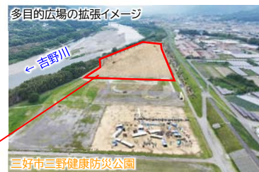
多目的広場の拡張イメージ