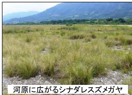
河原に広がるシナダレスズメガヤ