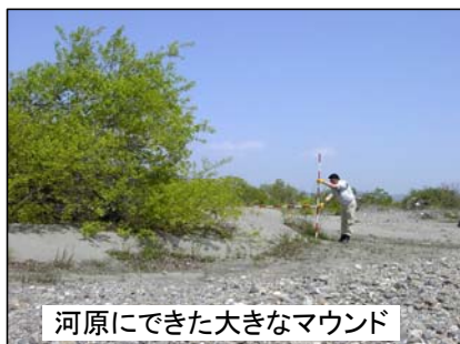
河原にできた大きなマウンド