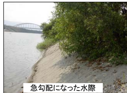
急勾配になった水際

最近、吉野川では、ヤナギなどの樹木が河原でたくさん生えることにより、河原に大きなマウンドができるなど、河原の姿が大きく変化しています。マウンドができることにより、外来植物であるシナダレスズメガヤが広がりやすくなるなど、もともと河原にいる生き物への悪影響が心配されています。