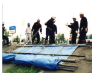
法崩れ対策：シート張り工