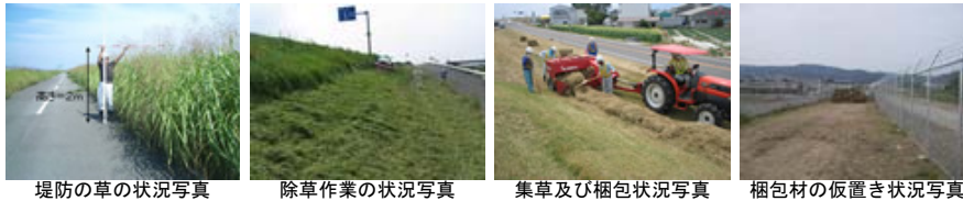
堤防の草の状況写真