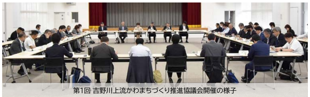
第1回 吉野川上流かわまちづくり推進協議会開催の様子

水辺空間を活かした県西部のさらなる発展を目指して地元自治体や市民団体、有識者と徳島県、河川管理者である徳島河川国道事務所が連携し、「吉野川上流かわまちづくり推進協議会」を設立し、令和7年5月30日(金)に第1回協議会を開催しました。