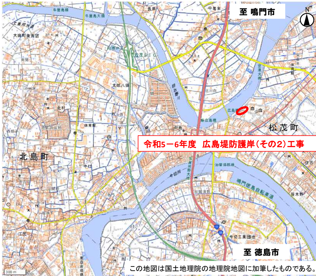
この地図は国土地理院の地理院地図に加筆したものである。