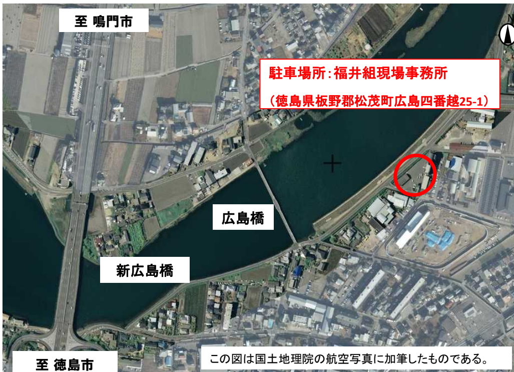
この図は国土地理院の航空写真に加筆したものである。