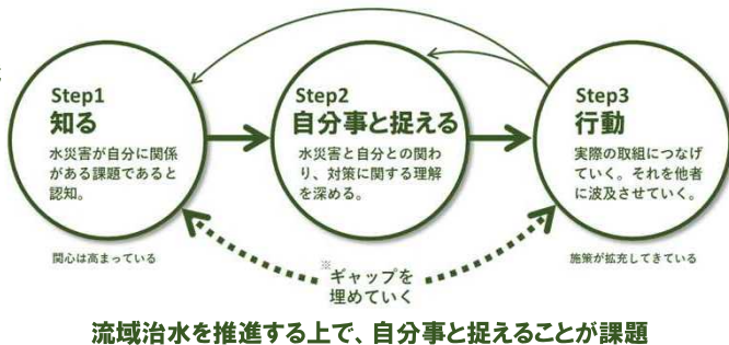
流域治水を推進する上で、自分事と捉えることが課題

水災害から自身を守ることからさらに視野を広げて、地域、流域の被害や水災害対策の全体像を認識し、自らの行動を深化させることで、流域治水の取り組みを推進する。 ※流域治水に取り組む主体を増やす(自分のためにから、みんなのために)