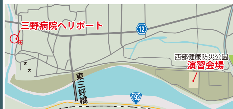
ライフライン復旧訓練場所