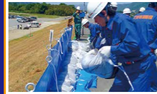
改良積み土のう工