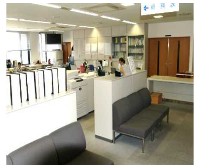
書庫等による執務室の区分