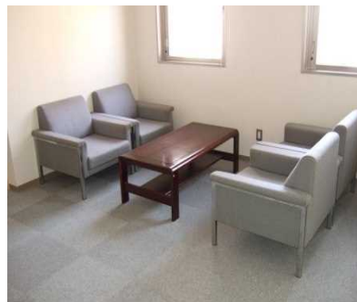
応接スペースの設置