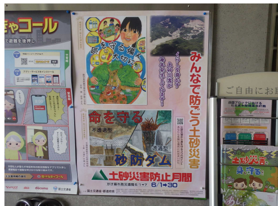
重信川砂防出張所