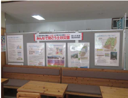
大川村山村開発センター