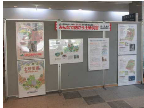
大豊町総合ふれあいセンター