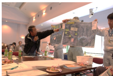
第1回 地域の防災を考える会の様子 (1)

第1回の結果をふりかえりながら、降雨時の行動と役割分担について、みなさんで確認しましょう。