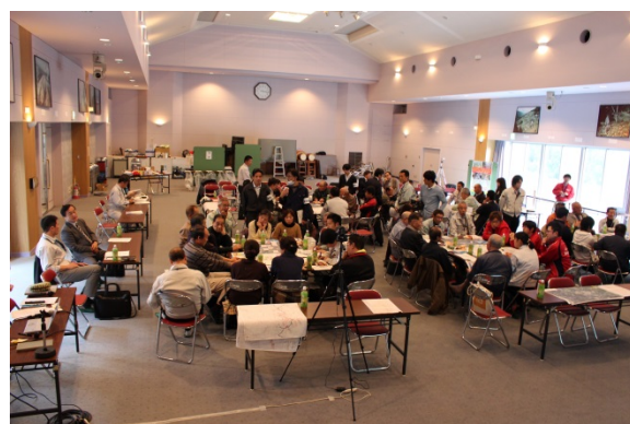
第1回 地域の防災を考える会の様子 (2)