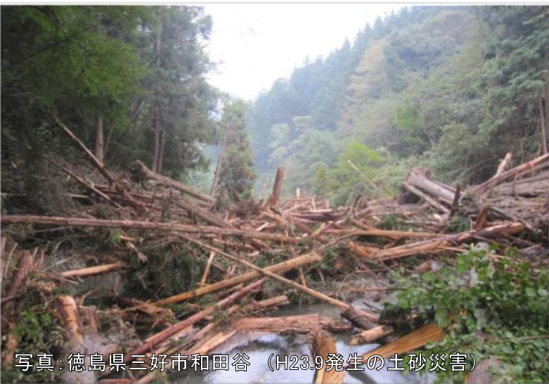
写真：徳島県三好市和田谷（H23.9発生 of 土砂災害）

前回は、土砂災害への備えについて地域のみなさんを中心に活発な意見交換が行われ、地域の現状や課題について情報共有ができました。