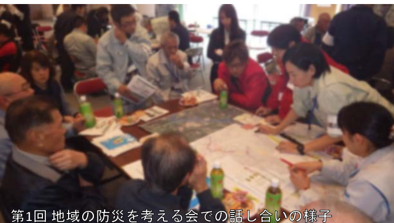
第1回 地域の防災を考える会での話し合いの様子