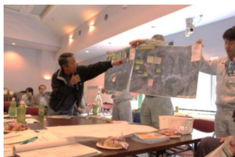
第1回 地域の防災を考える会の様子 (1)

第1回の結果をふりかえりながら、降雨時の行動と役割分担について、みなさんで確認しましょう。